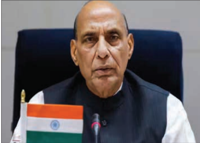
रक्षा मंत्री सिंह के बयान पर प्रतिक्रिया देकर कांग्रेस नेता रमेश ने आरोप लगाया कि यह बयान प्रधानमंत्री मोदी की स्वीकृति और निर्देश पर दिया गया है और इस बयान से पाकिस्तान को अप्रत्यक्ष रूप से राहत मिलती है।

दरअसल, रक्षा मंत्री सिंह ने एससीओ सम्मेलन में कहा था कि 'ऑपरेशन सिंदूर' भारत के दृढ़ संकल्प को दर्शाता है और अब आतंकवाद के केंद्रों को सजा से छूट नहीं मिलेगी। उन्होंने कहा कि आतंकवाद की कोई राष्ट्रीयता या धर्म नहीं होता और किसी भी प्रकार की शिकायत-चाहे वास्तविक हो या काल्पनिक-आतंकवाद को सही उखराने का आधार नहीं बन सकती।