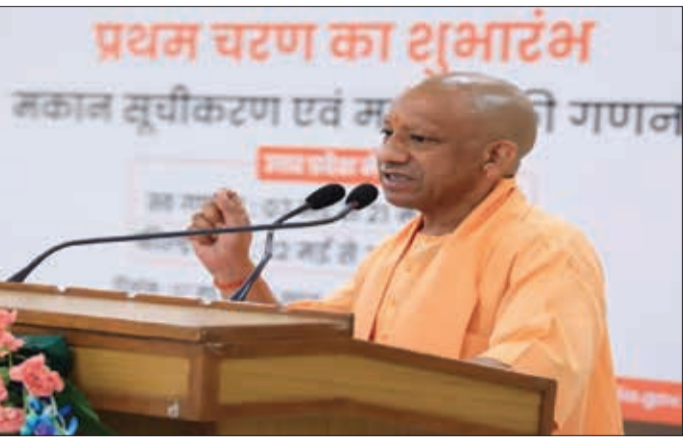
जनगणना हो रही है। प्रथम चरण में मकान सूचीकरण एवं मकानों की गणना से संबंधित कार्य हो रहे हैं। आमजन को 07 से 21 मई, 2026 तक स्वगणना का विकल्प उपलब्ध कराया गया है, जिसके माध्यम से नागरिक स्वयं डिजिटल फ्लैटफॉर्म पर अपनी जानकारी दर्ज कर सकते हैं। इसके उपरांत जनगणना कार्मिक घर-घर जाकर सूचीकरण का कार्य करने वाले हैं। द्वितीय चरण में प्रत्येक व्यक्ति की

लखनऊ (एजेंसी)। उत्तरप्रदेश के मुख्यमंत्री योगी आदित्यनाथ ने प्रदेश में जनगणना-2027 के प्रथम चरण का औपचारिक शुभारंभ किया। हमारी जनगणना, हमारा विकास की भावना के साथ मुख्यमंत्री आवास पर आयोजित कार्यक्रम में उन्होंने मकान सूचीकरण एवं मकानों की गणना कार्य का श्रीगणेश किया। इस मौके पर मुख्यमंत्री योगी ने स्पष्ट किया कि जनगणना केवल जनसंख्या की गणना भर नहीं है, बल्कि समग्र, समावेशी और सुनियोजित विकास का सशक्त आधार है।