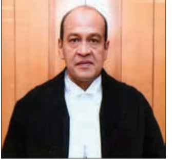
अपने फैसले में जस्टिस यशवंत वर्मा की फाइल को राष्ट्रपति और प्रधानमंत्री के समक्ष भेजा था और कहा था कि उन्हें हटाने की प्रक्रिया शुरू की जा सकती है।

वर्मा ने अपने इस्तीफे में तत्काल प्रभाव वाली बात लिखी थी। नियम के मुताबिक उन्हें तत्काल ही जज की सूची से हट जाना चाहिए। इसके अनुसार यदि कोई जज अपना इस्तीफा राष्ट्रपति के नाम लिखता है तो वह जिस तारीख से उसके लागू होने की बात करेगा, उसी दिन से वह माना जाएगा। यदि वह तत्काल प्रभाव वाली बात लिखता है तो फिर वही लागू होगा। सुप्रीम कोर्ट की 5 जजों की बेंच ने 15 फरवरी, 1978 को जस्टिस गोपाल चंद्र मिश्रा के केस में फैसला दिया था और बताया था कि यदि कोई जज अपना इस्तीफा राष्ट्रपति को भेजता है तो फिर उसे निश्चित तारीख से माना जाएगा। बता दें जस्टिस यशवंत वर्मा के मामले में पूर्व चीफ जस्टिस संजीव खन्ना की बेंच में सुनवाई भी हुई थी। उन्होंने