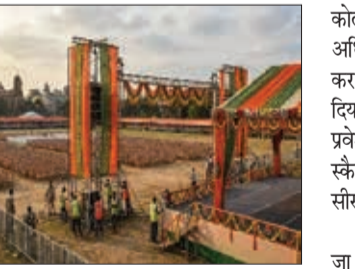
करीब 4,000 पुलिसकर्मियों को तैनात किया जाएगा। प्रत्येक सेक्टर की निगरानी पुलिस उपायुक्त या सहायक पुलिस आयुक्त स्तर के अधिकारी करेंगे। अधिकारी ने बताया कि जरूरत पड़ने पर केंद्रीय सशस्त्र पुलिस बल को भी तैनाती की जा सकती है।

कोलकाता (एजेंसी)। कोलकाता स्थित ब्रिगेड परेड ग्राउंड में पश्चिम बंगाल में बीजेपी की पहली सरकार के शपथ ग्रहण समारोह के लिए करीब 4,000 पुलिसकर्मियों को तैनात किया जाएगा। एक वरिष्ठ अधिकारी ने बताया कि पश्चिम बंगाल में बीजेपी की पहली सरकार का शपथग्रहण समारोह 9 मई को आयोजित किया जाएगा। अधिकारियों ने बताया कि शनिवार को शपथ ग्रहण समारोह में पीएम मोदी, केंद्रीय गृह मंत्री अमित शाह और बीजेपी के कई वरिष्ठ नेताओं के शामिल होने की संभावना को देखते हुए इस मैदान को प्रभावी भीड़बंधन और सुरक्षा के लिए करीब 30 सेक्टरों में बांटा गया है।