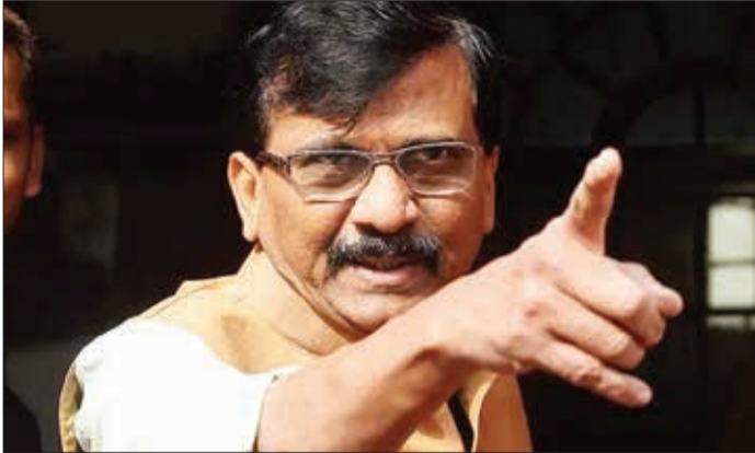
बार जगत भ्रमण करना चाहते हैं।