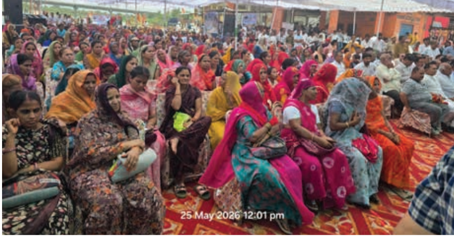
लक्ष्य निर्धारित किया गया है।

विशाल वृक्षारोपण लक्ष्य: 'मिशान हरियाली राजस्थान' के तहत इस वर्ष 10 करोड़ पौधे लगाने का