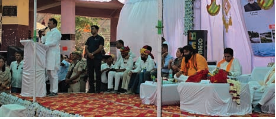
स्मार्ट हलचल। माण्डलगढ़

गंगा दशहरा के पावन अवसर पर माण्डलगढ़ स्थित त्रिवेणी संगम (बनास, बेड़च एवं मेनाली नदियों का महासंगम) पर जल संरक्षण को जनआंदोलन बनाने के उद्देश्य से 'वदे गंगा जल संरक्षण जन अभियान-2026' का भव्य आयोजन किया गया। मेवाड़ के प्रयागराज के रूप में विख्यात इस संगम पर विधि-विधान और वैदिक मंत्रोच्चार के बीच जल पूजन कर प्रदेश की सुख-समृद्धि की कामना की गई।