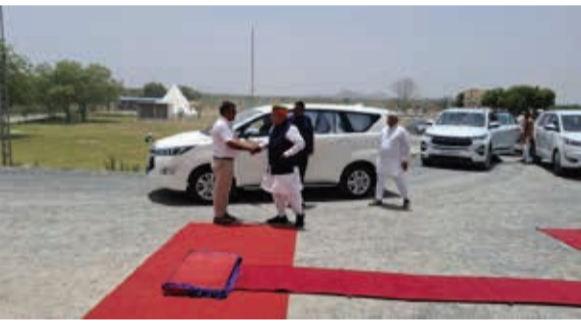
स्मार्ट हलचल। भीलवाड़ा

एक ओर देश-दुनिया में वैश्विक संकट और तनावपूर्ण हालात बने हुए हैं, वहीं दूसरी ओर भीलवाड़ा जिले में वीआईपी दौरे का सिलसिला लगातार जारी है। सवाल यह उठ रहा है कि आखिर ऐसे संवेदनशील माहौल में भी नेताओं के दौरे क्यों नहीं थम रहे? रविवार को केंद्रीय मंत्री के दौरे के बाद अब सोमवार 25 मई को राजस्थान के उप मुख्यमंत्री डॉ. प्रेमचंद बैरवा माण्डलगढ़ क्षेत्र के त्रिवेणी पहुंचेंगे। यहां वे 'वदे गंगा' जल संरक्षण जन अभियान कार्यक्रम में भाग लेंगे।