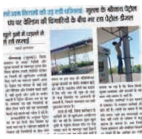
स्मार्ट हलचल | भीलवाड़ा

गुरला में श्रीनाथ पेट्रोल पंप द्वारा नियमों की अनदेखी करने का मामला सामने आने के बाद स्मार्ट हलचल ने इस लापरवाही को प्रमुखता से प्रकाशित किया। जिसके बाद जिला प्रशासन हरकत में आया और पेट्रोल पम्प को सीज कर दिया। अग्रिम आदर्शों तक पेट्रोल पंप पर बिक्री और निर्माण कार्य पर रोक रहेगी। स्मार्ट हलचल ने उक्त खबर को 'सरेआम नियमों की उड़ रही धज्जियां': गुरला के श्रीनाथ पेट्रोल पंप पर वेल्डिंग की चिंगारियों के बीच भरा जा रहा पेट्रोल डीजल, खुले ड्रमों में