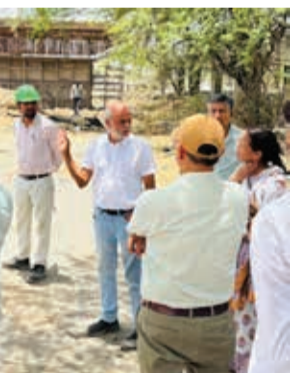
स्मार्ट हलचल | भीलवाड़ा

दिवावली तक मिल सकती है पुलिया की सौगात, अधिकारियों को दिए सख्त निर्देश, सितंबर तक कार्य पूर्ण करने का दावा