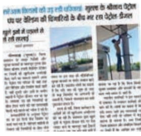
स्मार्ट हलचल | भीलवाड़ा

तिलस्वां घाटे के सुरक्षा इंतजाम केवल कागजों तक सीमित हैं। अभी दो दिन पहले, यानी रविवार को भी इसी घाट पर 'शिव शक्ति ट्रेवल्स' की बस पलटने से करीब 30 यात्री गंभीर रूप से घायल हुए थे। उस हादसे के बाद भी प्रशासन ने कोई सबक नहीं लिया। घाट पर न तो पर्याप्त संकेतक हैं, न ही रिफ्लेक्टर और मजबूत फ्रैश बैरियर। रोजाना हो रहे इन हादसों ने साबित कर दिया है कि जिम्मेदार अधिकारी जनता की जान की कीमत पर तमाशबीन बने हुए हैं।