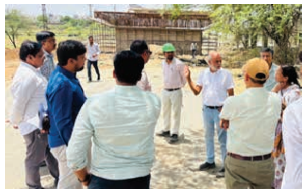
स्मार्ट हलचल | भीलवाड़ा

दिवावली तक मिल सकती है पुलिया की सौगात, अधिकारियों को दिए सख्त निर्देश, सितंबर तक कार्य पूर्ण करने का दावा