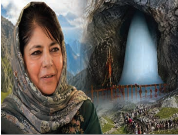
इस वर्ष यात्रा 3 जुलाई से शुरू होकर 28 अगस्त को समाप्त होगी, जो कुल 57 दिनों तक चलेगी। श्रद्धालु अंततः गुजरात जिले के पारंपरिक 48 किलोमीटर लंबे 'नुनवान-पहलगाम मार्ग' और