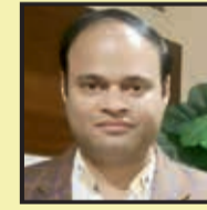
कुंजबिहारी चाण्डक मंत्री बसंत विहार