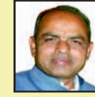
मनोहर अजमेरा संयुक्त मंत्री नगर सभा