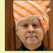
दीनदयाल मारु प्रदेश अर्थ मंत्री