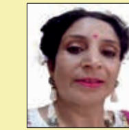
भारती बाहेती जिला अध्यक्ष म. सं.