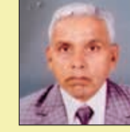
प्रहलाद लड़ा मंत्री महेश सेवा निधि