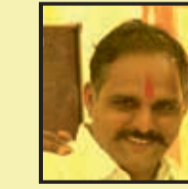
अधिवन तोतला मंत्री चन्द्रशेखर आजादनगर