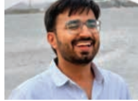
प्रक्रिया संपन्न हुई।