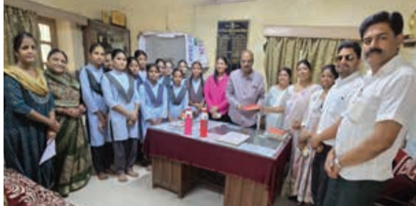
स्मार्ट हलचल। बूंदी